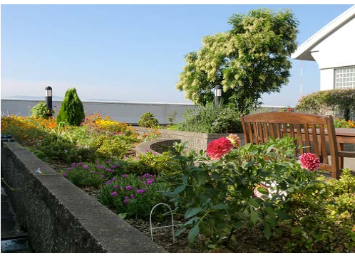
■生まれ変わった悠々亭 屋上庭園(今年9月撮影)

悠々亭の6階に庭園があるのをご存じでしょうか?これまで、悠々亭の職員の手によって手入れをしていましたが、ご利用者のみなさまに、見て楽しんでもらえる程の華やかな庭園を造ることができておりませんでした。そんな中、今年6月頃に地域のボランティアさん2名から、「協力したい!ご利用者の皆さまに、四季折々の花を楽しんで欲しい!」とのお声をいただき、庭造りがスタートしました。現在では、総勢7名ものボランティアさんにお力添えをいただき、華やかな庭園へと生まれ変わりました。