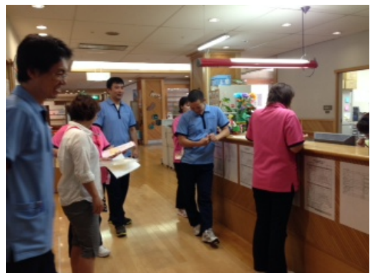
私たち感染対策チームは、月に1回ラウンドを通して、互いに感染予防をしましょうと声をかけています。