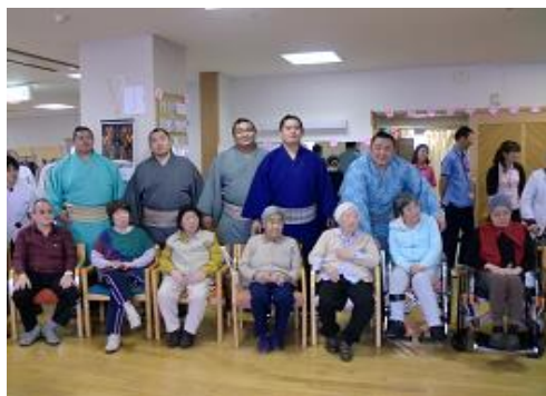
写真1:片男波部屋の力士と通所のご利用者