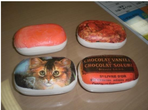
写真2: 完成したデコパージュ石鹸

平成26年3月21日(金)、デコパージュ石鹸作りのイベントを行いました。普段から趣味として取り組んでいた職員が講師になり、ご利用者に「楽しみながら取り組める手作業」として企画しました。準備段階では、説明用のプリントを作成し、手順・使用物品の取り扱いなどを全職員に伝達しました。