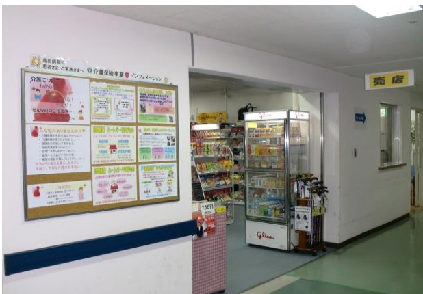
島田病院の売店入口に設置された案内掲示板

はあとふるグループには、在宅生活を支援するために、居宅介護支援・介護老人保健施設・通所リハビリテーション・通所介護・訪問看護(看護師・療法士)・訪問介護・在宅介護支援センター・サービス付き高齢者住宅の八つの事業があります。介護に関する不安を抱えた方が、はあとふるグループを訪れた時に、この掲示板を見ていただくことによって、相談するきっかけにつながると思います。