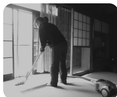
ご自宅の環境整備を行いながら日常生活の様子や体調などの確認をしています！