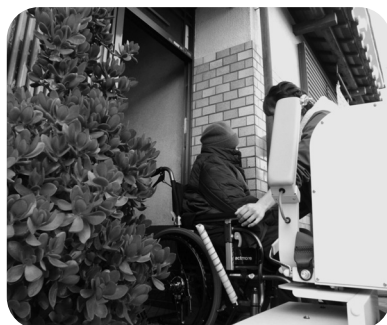
玄関が2階という環境。外出時に昇降機での出入りをサポートしています！